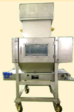
コンベア付き 950x980xH1500mm 240kg