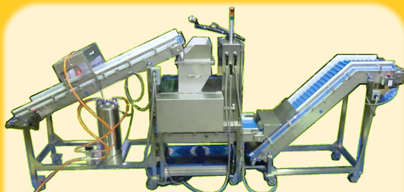
投入～ほぐし～搬出 自動化ライン 800x4000xH1500mm 550kg