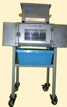
コンベアなし 930x650xH1500mm 180kg